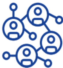
Социальные и медиа каналы